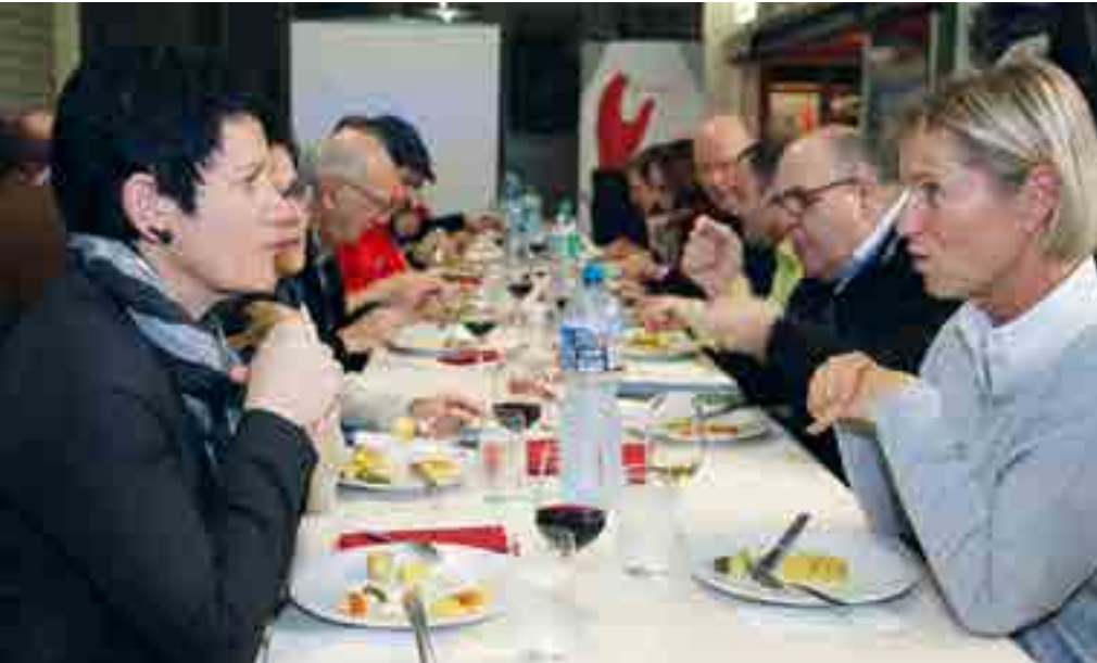
Die Gäste geniessen das Raclette

Am Donnerstag, 10. Januar 2019, fand der traditionelle Neujahrsapéro im Gewerbegebiet statt.